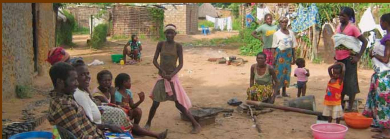
Reunião com a comunidade