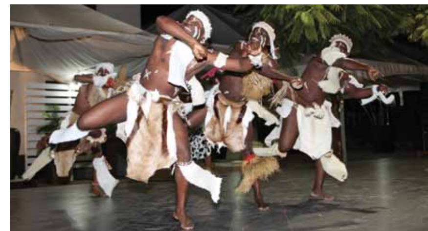
Actuação do Ballet Kilandukilu