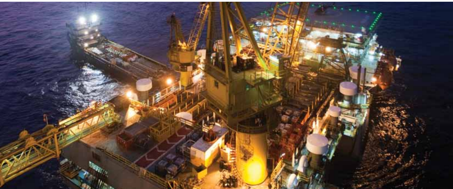
Plataforma Tómbua-Lândana, à noite