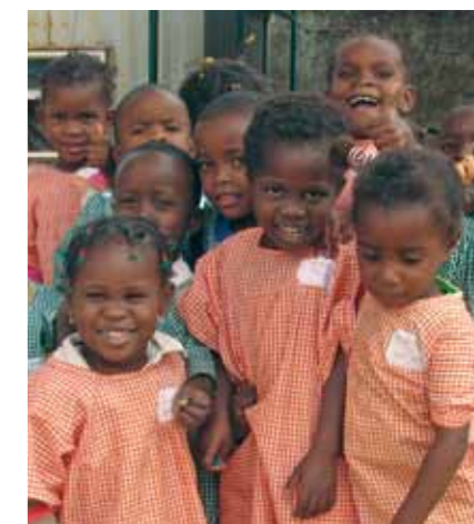
Crianças do Orfanato Pequena Semente

Doações de Alimentos em Cabinda: uma doação dos parceiros do Bloco O para a ajuda alimentar a mais de 500 crianças e idosos de várias instituições de caridade e orfanatos em Cabinda.