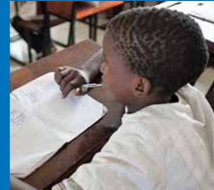
Alunos e professores participaram activamente no concurso de escrita

‘Tenho a certeza de que de agora em diante vou agarrar-me a estes livros.’