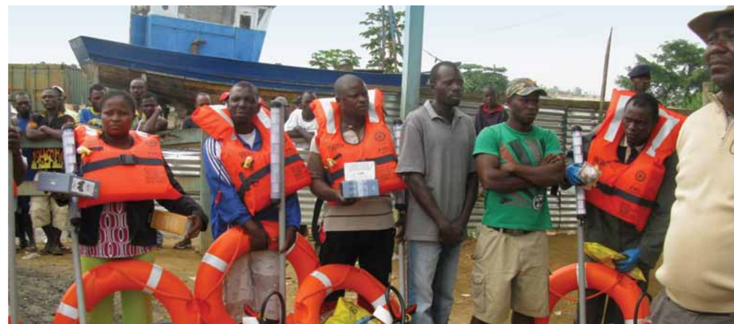
Membros da comunidade piscatória na cerimónia de entrega do equipamento