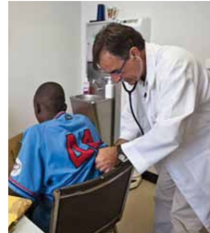
Campanha de vacinação contra a poliomielite

No contrato de extensão da concessão do Bloco O, prorrogado até 2030, a CABGOC e os seus parceiros decidiram atribuir USD 80 milhões como bónus social. Este montante