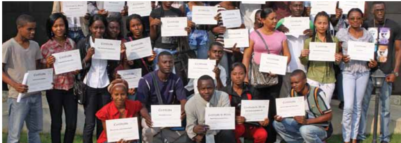
Estudantes de Cabinda exibem os seus certificados de bolsa de estudo