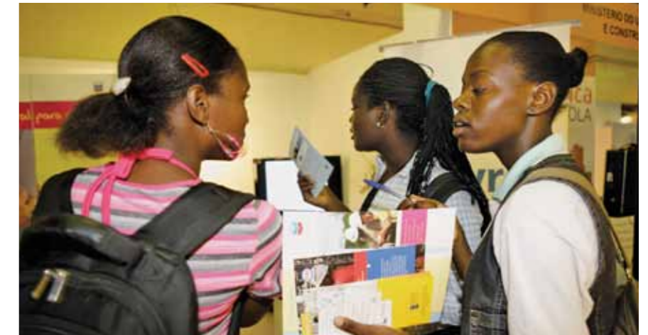
Potenciais candidatos numa feira de emprego

Lançada a construção de um centro de recursos de professores nas províncias de Luanda e do Cunene, para facultar espaços para os professores melhorarem as suas aptidões de informação tecnológica.