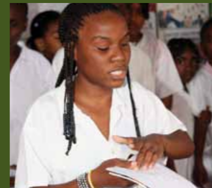
Aluna da Escola Óscar Ribas a ler texto em Braille

‘Tenho a certeza de que de agora em diante vou agarrar-me a estes livros.’