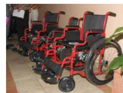
Doação de cadeiras de rodas ao Fundo Lwini