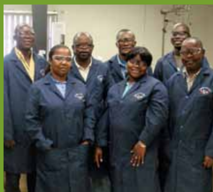
Equipa do Laboratório do Malongo

‘O nosso objectivo é tornar o Laboratório de Malongo conhecido como o melhor em África e atingir um desempenho de excelência a nível mundial.’