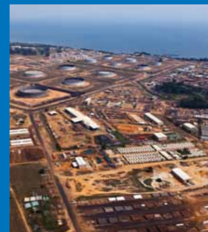
Vista aérea do Terminal do Malongo

‘Tentamos nunca nos esquecer de por em prática o princípio operacional O que você vê passa a ser responsabilidade sua.’