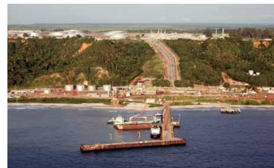
Terminal do Malongo